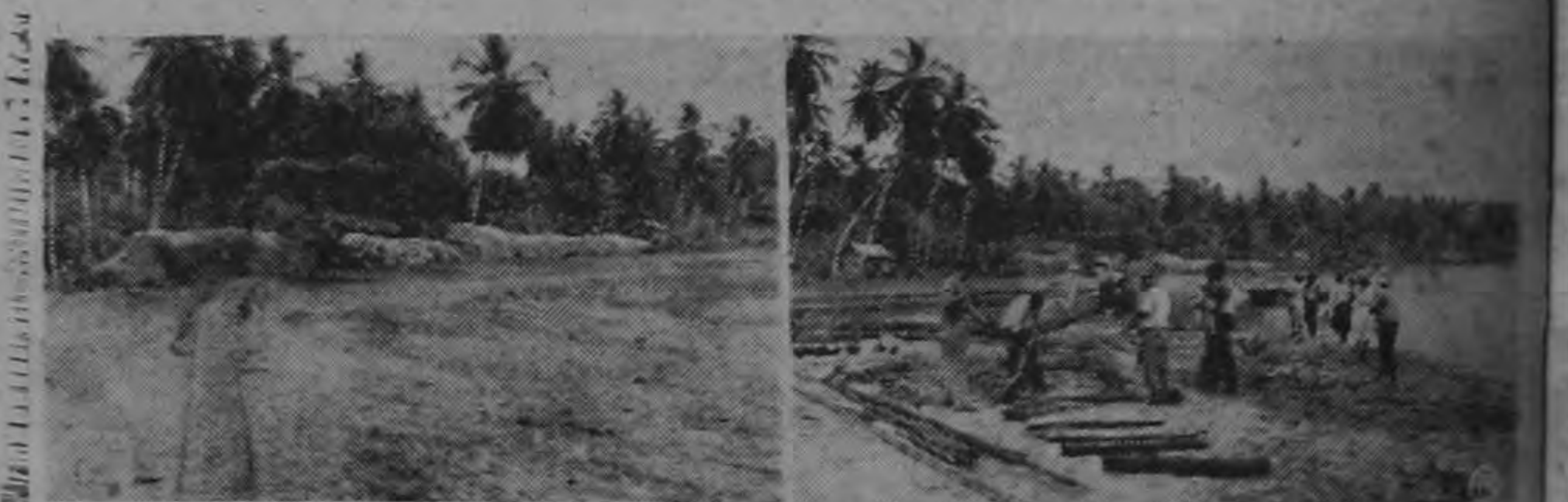
A la izquierda: mineral listo para ser transportado; a la derecha: cuadrillas de trabajadores construyendo una línea férrea en la zona de Puerto Viejo, desde las minas hasta el muellecito.

Puerto Nuevo es un distrito de Limón situado a dos horas en lancha al sur del Puerto del Atlántico.