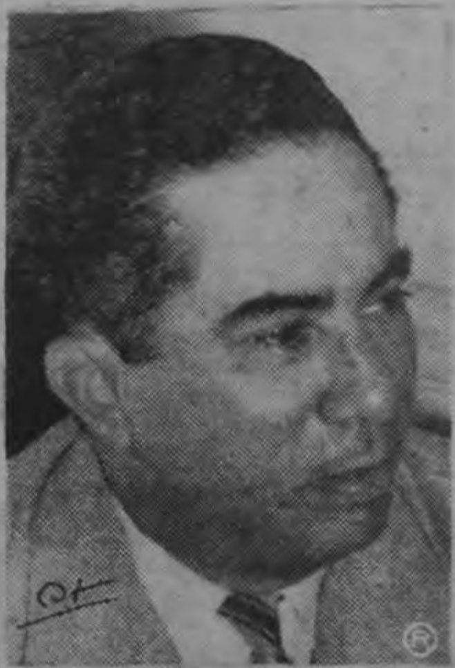
Señor don Emilio Rodríguez Demorizi, Embajador de República Dominicana en nuestro país.

Estuvo ayer en nuestras oficinas el señor don Emilio Rodríguez Demorizi, Embajador de la República Dominicana en nuestro país, en visita de cortesía que agradecemos.