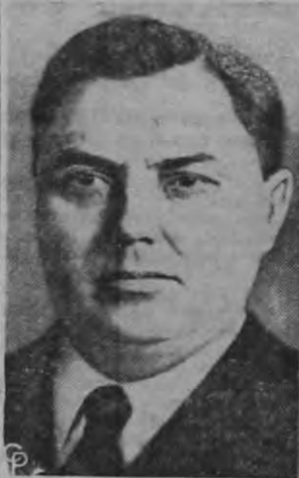
Georgi M. Malenkov